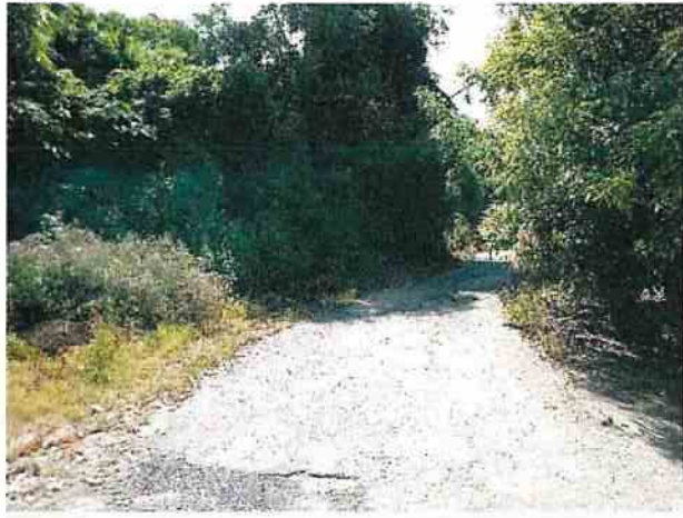
地點4 通往遺址東側產業道路周邊維持現狀。