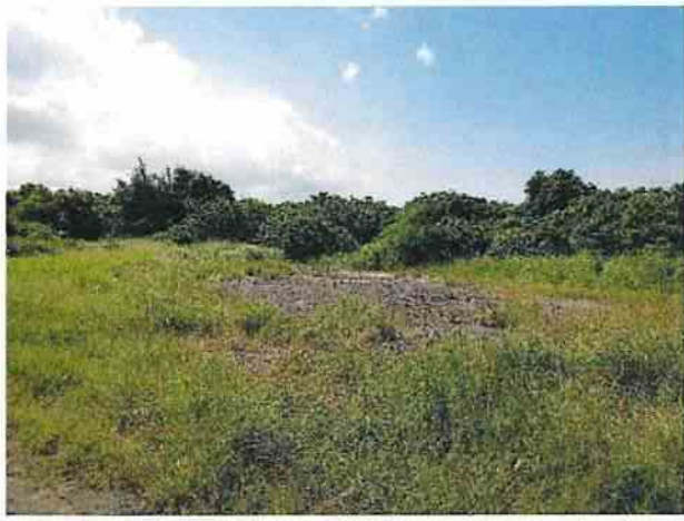
地點18 遺址南側巽林段1087地號維持現狀。