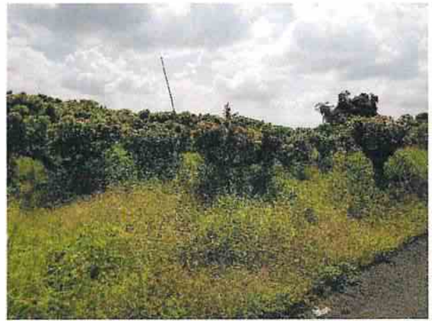
地點19 位於巽林段1051地號芒果園目前維持現狀。