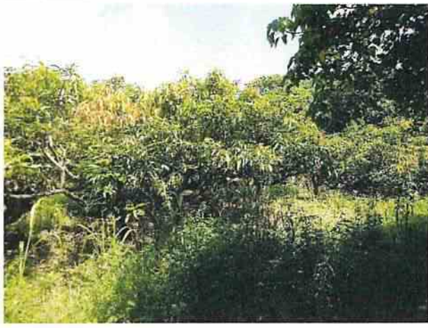
地點29 龔林段1049地號東側芒果園維持現況。