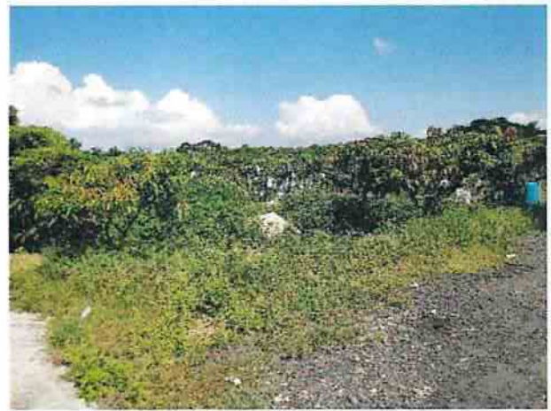
地點20 位於巽林段1049地號東側芒果園目前維持現狀。