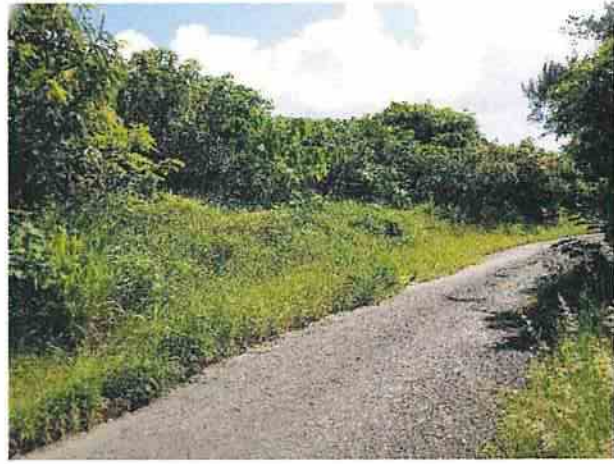
地點16 遺址南側巽林段1086地號雜林維持現況。