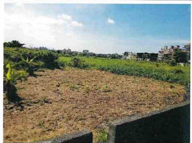
地點1 位於遺址西南側興林段1107地號，土地上的雜草已割除。