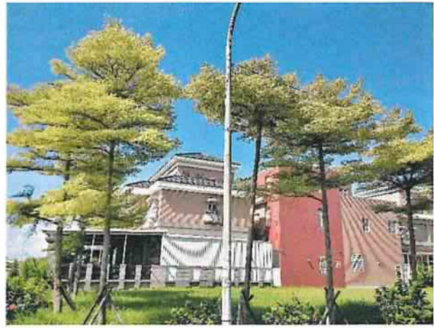
地點2 位於遺址外西南側二號監視器，維護良好正常運作。