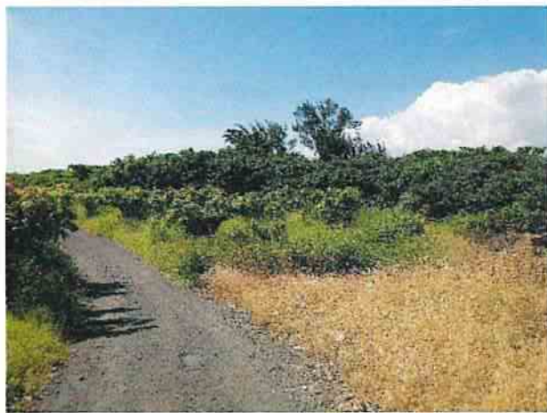
地點19 位於巽林段1049地號東南側芒果園目前維持現狀。