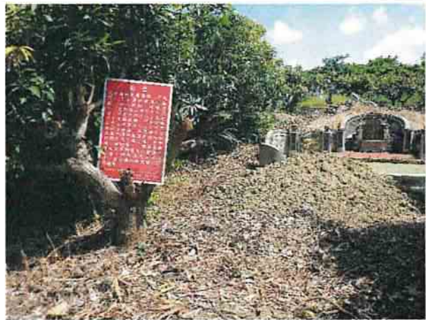
地點25 上述情形近照：推放在墓前方之土壤。