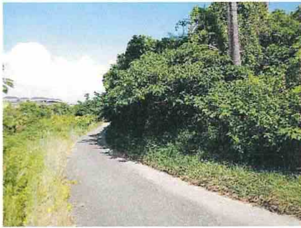
地點16 遺址南側巽林段1086地號雜林維持現況。