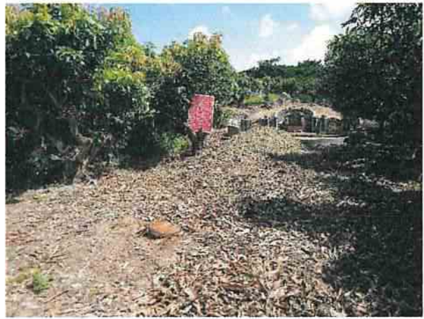
地點24 龔林段1056地號西南側區塊有兩棵果樹已移除僅留樹根，周邊雜草清除，墓前方有新運來堆放之土壤，此情形暫時無影響到地面下之地層。目前緊急架設告示牌，告知本區為遺址範圍，如有任何破壞遺址之行為將進行開罰。