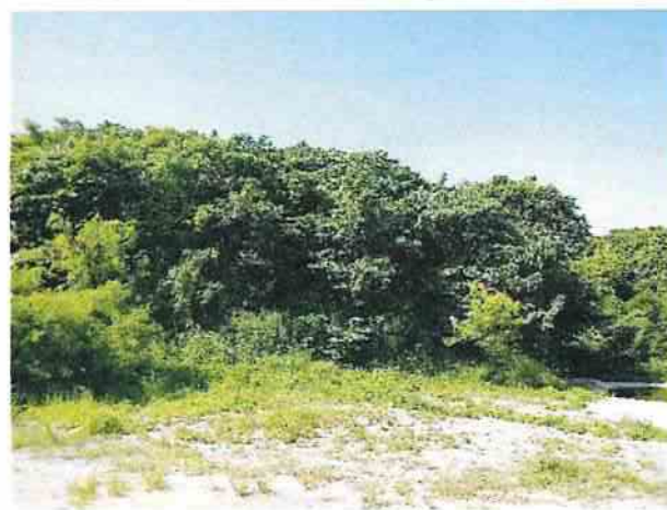
地點12 遺址西北側邊界巽林段1049-1地號維持現狀。