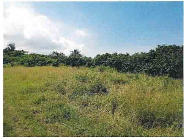
地點15 位於遺址西側巽林段1049-1地號西南側平台草皮維持現狀。