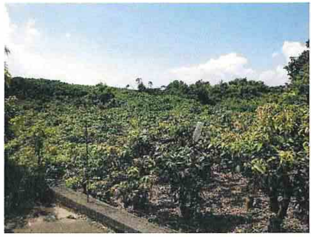
地點29 龔林段1040地號芒果園維持現況。