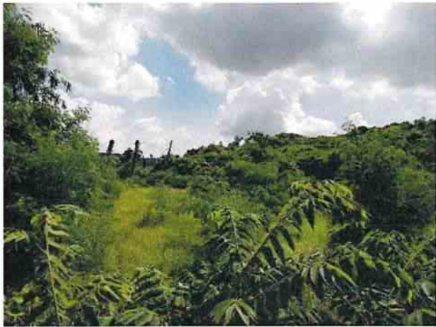
地點13 遺址西北側邊坡巽林段1049-5地號雜林維持現況。