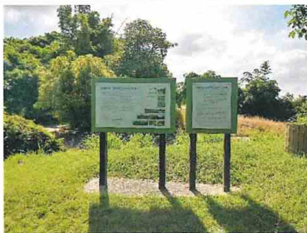
地點3 位於遺址外西南側翡翠森林公園內，鳳鼻頭考古遺址解說牌維護狀況良好。