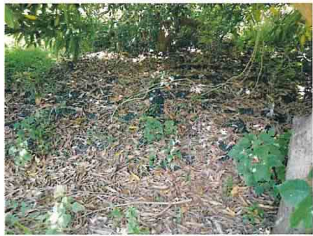
地點29 位於興林段1049地號東側邊坡維持現況。