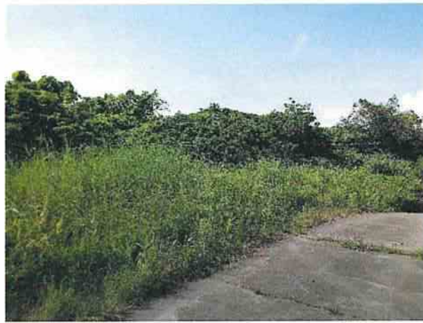
地點7 位於遺址西側巽林段1049地號南側樹林維護良好。