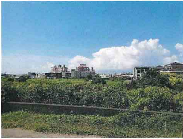
地點16 遺址西南側巽林段1082地號芒果園維持現況。