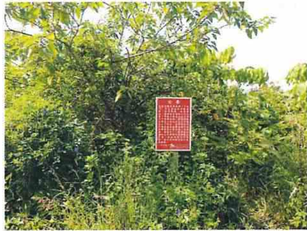
地點18 位於巽林段1087地號告示牌維護良好。