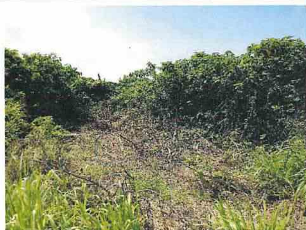
地點8 位於遺址西側巽林段1049地號植被有部分被砍除，僅留樹根，未影響到地面下之地層。