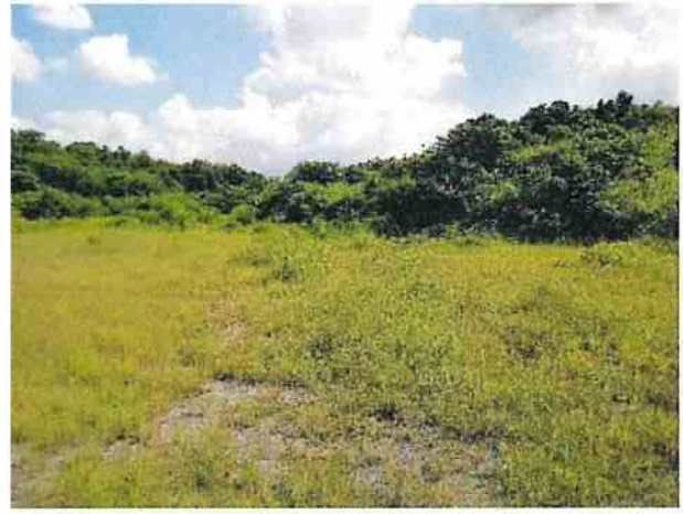
地點12 遺址西北側邊坡巽林段1049-5地號地勢向東抬升。