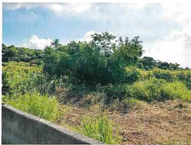
地點1 位於遺址西南側興林段1106地號維持現狀。