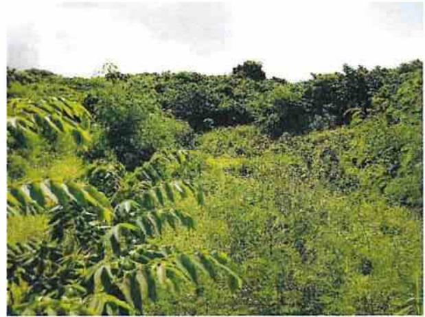
地點13 遺址西北側邊坡巽林段1049-5地號地勢向南抬升。