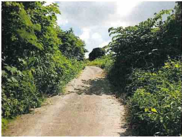
地點6 位於興林段1083地號產業道路東西兩側邊坡維持現狀，植被茂盛。