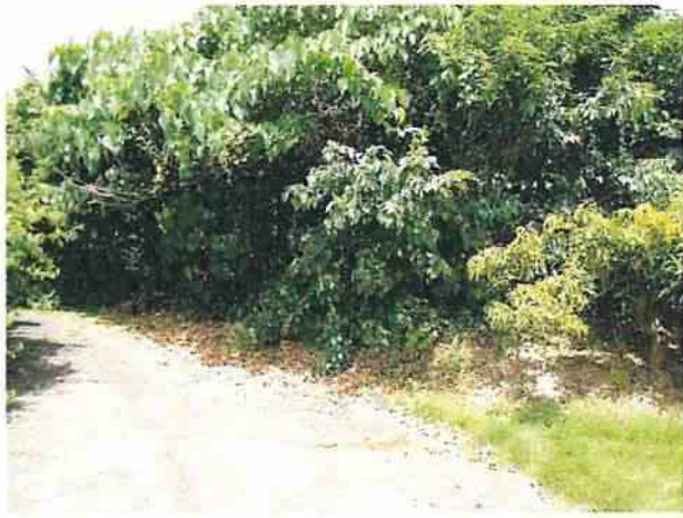
地點29 龔林段1049地號東北側雜林維持現況。