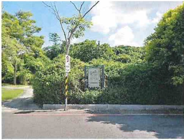
地點2 位於遺址外西南側，鳳鼻頭考古遺址解說牌維護狀況良好。