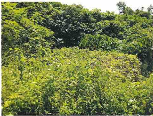
地點29 位於興林段1049-3地號西側設有箱型石籠減緩沖刷，現況維護良好。