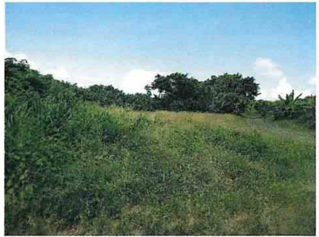
地點7 位於遺址西側興林段1049-1及1084地號草皮維護良好。