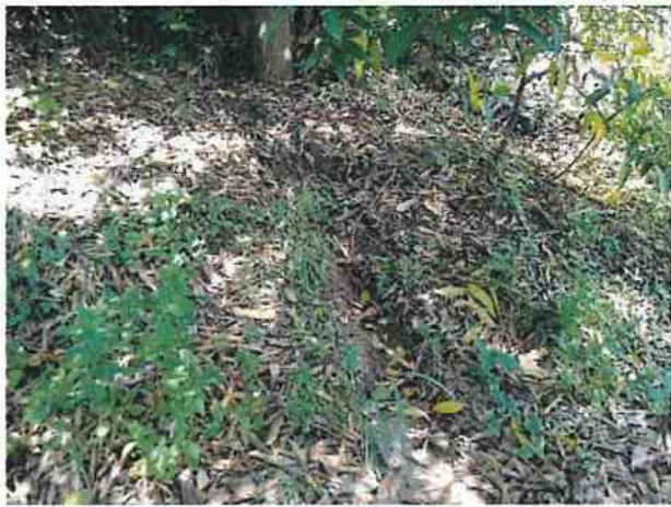
地點22 位於龔林段1049地號東側邊坡有沖刷痕跡，已請水土保持技師評估，目前無擴大跡象。