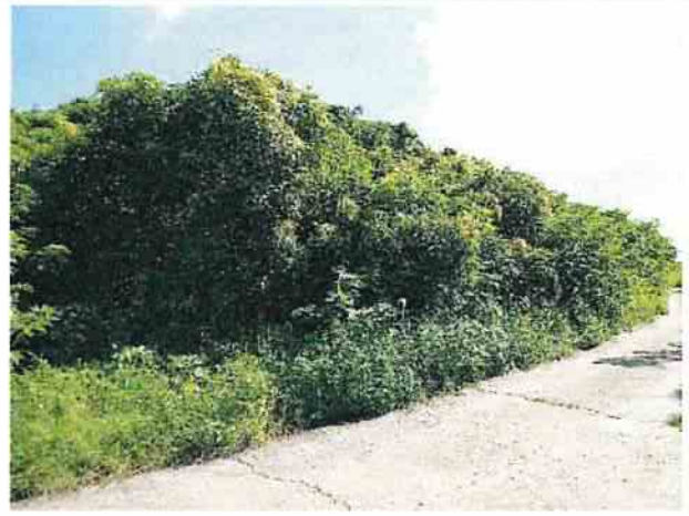
地點5 位於興林段1083地號產業道路西側邊坡維持現狀，植被茂盛。