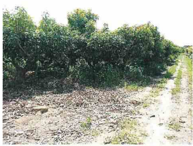
地點26 上述現象的周圍及連外道路現況。