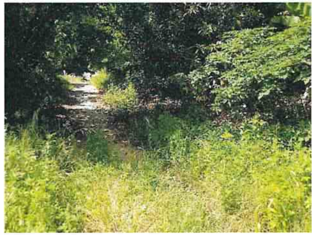
地點29 通往遺址北方兩側維持現況。