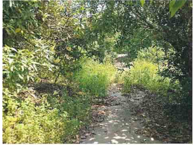
地點22 位於龔林段1049、1049-3地號兩側邊坡維持現況。