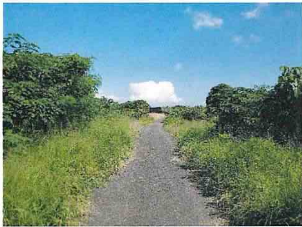
地點19 通往遺址東側道路巽林段1049-1地號兩旁無異狀。