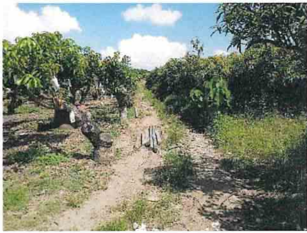
地點27 上述現象的周圍及連外道路現況。