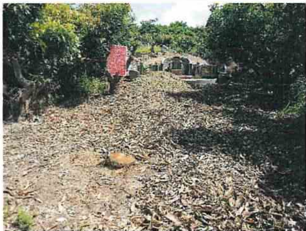
地點25 上述情形近照：果樹留存的樹根，周邊雜草已清除。