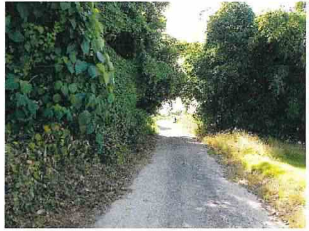
地點4 通往遺址東側產業道路周邊維持現狀。