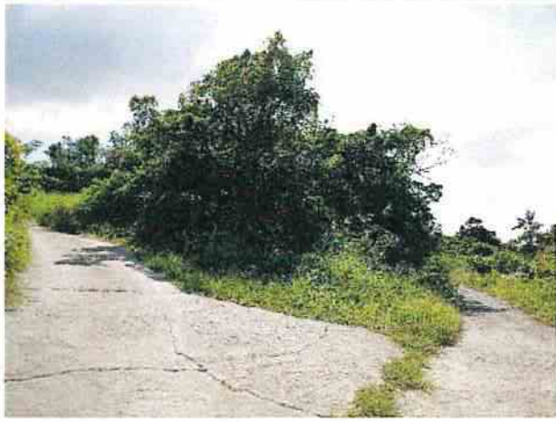
地點5 遺址內產業道路左側通往遺址北方，右側通往遺址東側。