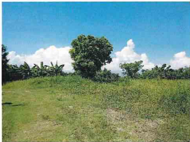
地點14 位於遺址西側巽林段1049-1地號西南側平台草皮維持現狀。