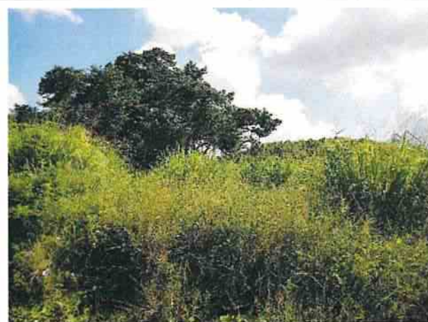
地點11 巽林段1054地號植被維持現況。