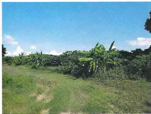
地點7 位於遺址西側巽林段1049地號草皮維護良好。