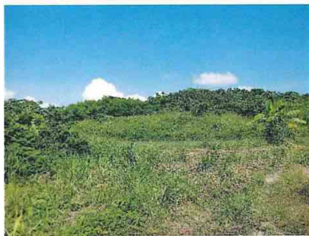
地點8 巽林段1049-1地號西側植被維持現況。