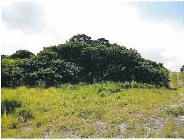
地點12 遺址西北側邊坡巽林段1049-5地號地勢向東抬升。