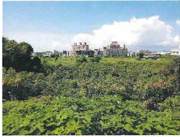
地點16 遺址西南側巽林段1085地號芒果園維持現況。