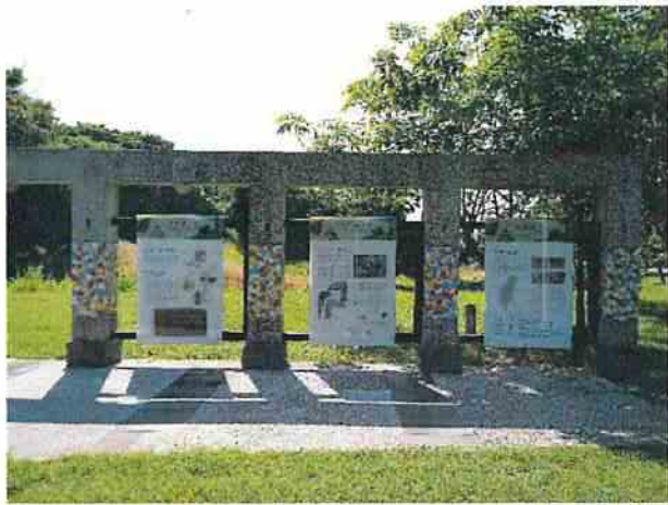
地點3 位於遺址外西南側翡翠森林公園內，鳳鼻頭考古遺址解說牌維護狀況良好。