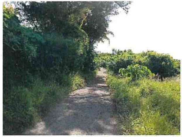
地點18 通往遺址東側道路兩旁無異狀。