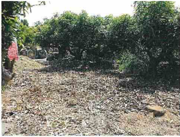
地點26 上述現象的周圍現況。