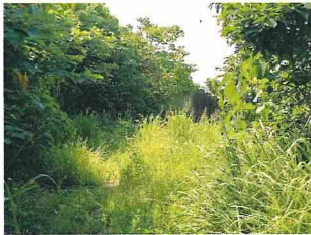
地點17 遺址南側巽林段1091地號維持現況，該區雜草高大不易進入。