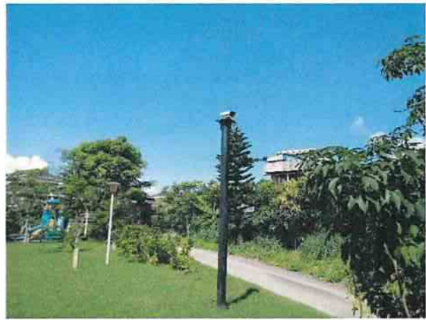
地點3 位於遺址外西南側一號監視器維護良好正常運作。