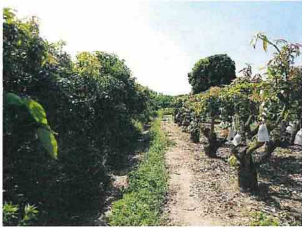
地點21 位於龔林段1056地號東側芒果園目前維持現狀。