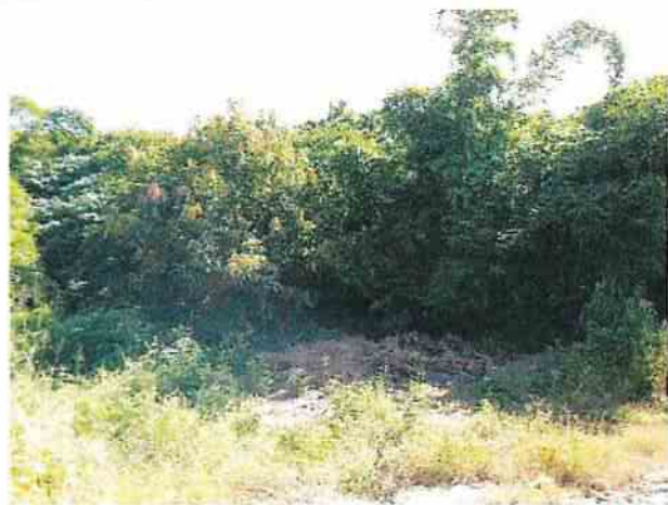
地點4 位於遺址西南側邊緣興林段1049-1地號西南側邊緣，地勢陡升植被茂盛。